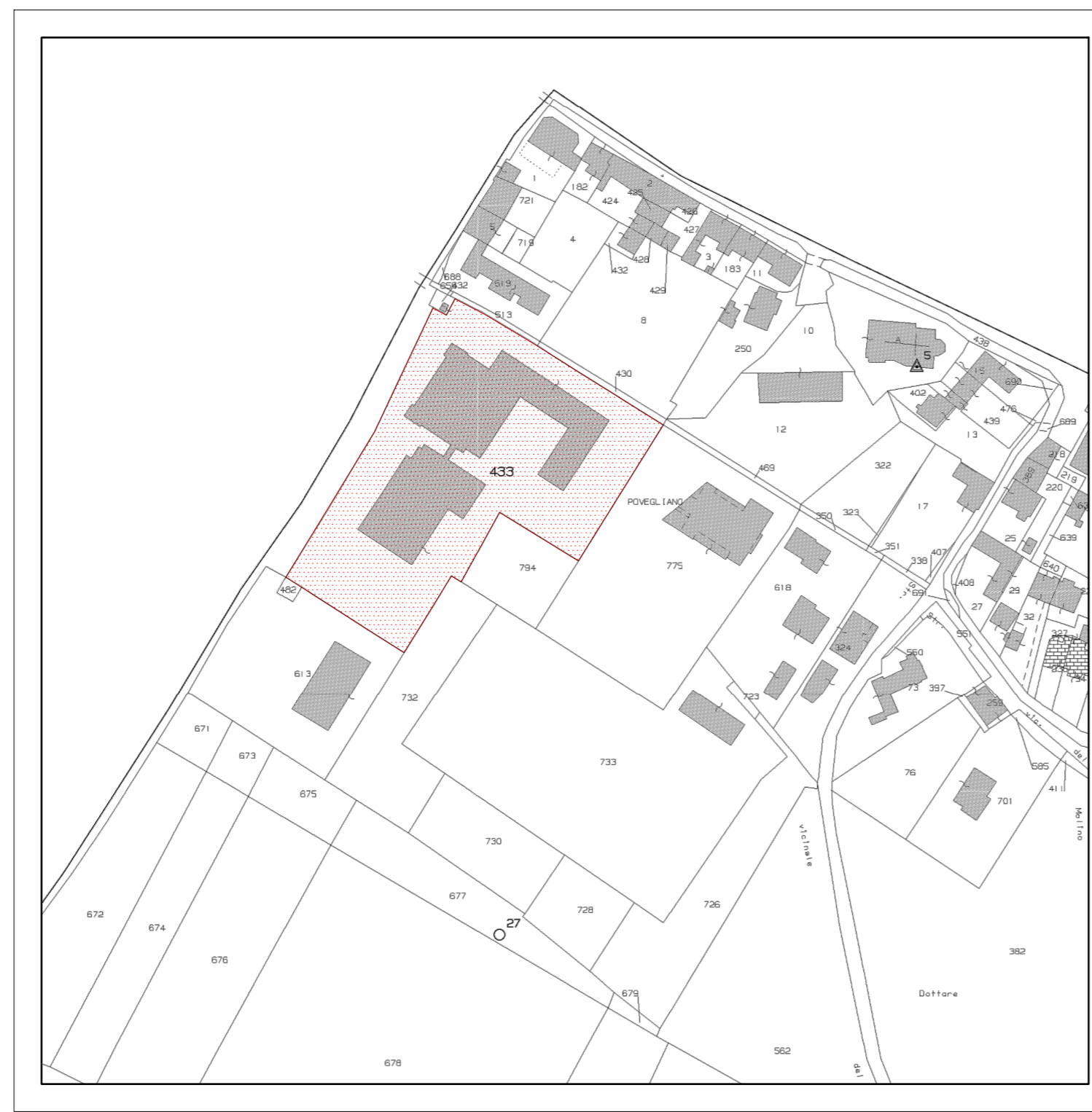
ESTRATTO MAPPA SCALA 1:2000