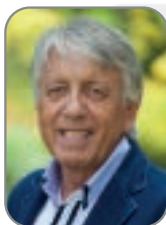
Rino Manzan Sindaco

Affari generali, personale, lavori pubblici, urbanistica, edilizia privata, polizia locale, sicurezza, sanità, protezione civile.