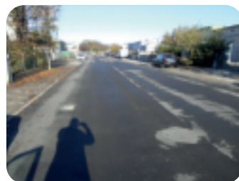
Via Prato della Valle