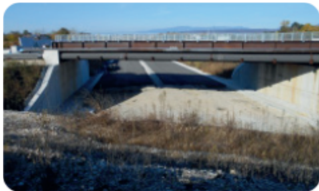
SPV vista da Via Arcade

✓ la modifica della tipologia di innesto su via Molinella da via Campagnola con l' eliminazione del sovrappasso originariamente previsto per accedere al borgo dei "Campeotto".