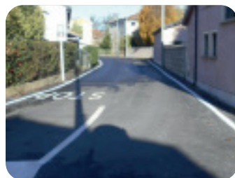
Via Borgo S. Matteo