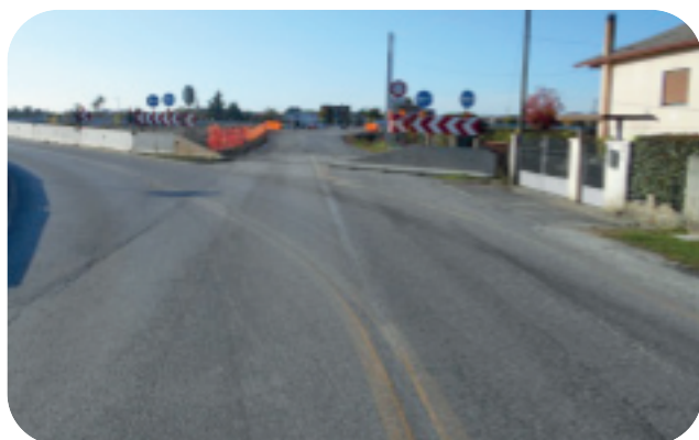
Deviazione in Via Arcade

Potete continuare a segnalare eventuali disservizi o vostre preoccupazioni chiedendo appuntamento presso gli uffici comunali il mercoledì dalle ore 17,00 alle 19,00, o se preferite inviando una mail al seguente indirizzo: protocollo@comune.povegliano.tv.it indicando i vostri dati anagrafici ed il vostro recapito telefonico.