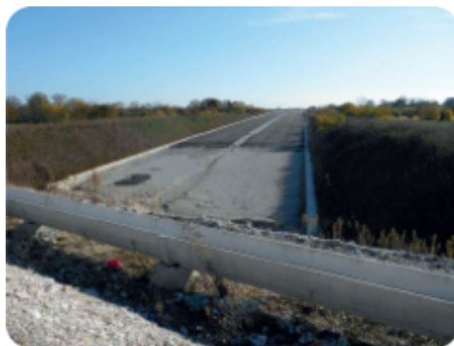
SPV vista da Via Molinella