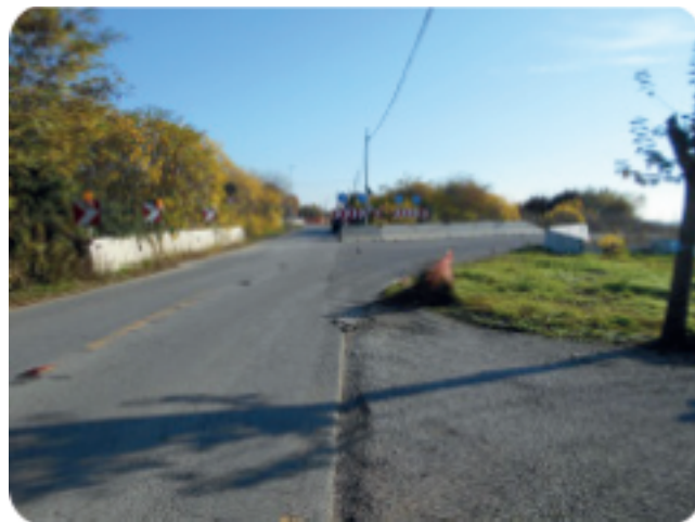
Deviazione in Via Molinella

Potete continuare a segnalare eventuali disservizi o vostre preoccupazioni chiedendo appuntamento presso gli uffici comunali il mercoledì dalle ore 17,00 alle 19,00, o se preferite inviando una mail al seguente indirizzo: protocollo@comune.povegliano.tv.it indicando i vostri dati anagrafici ed il vostro recapito telefonico.