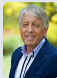
Rino Manzan Sindaco

Affari generali, personale, lavori pubblici, urbanistica, edilizia privata, polizia locale, pubblica sicurezza, protezione civile, servizi culturali, gentilezza..