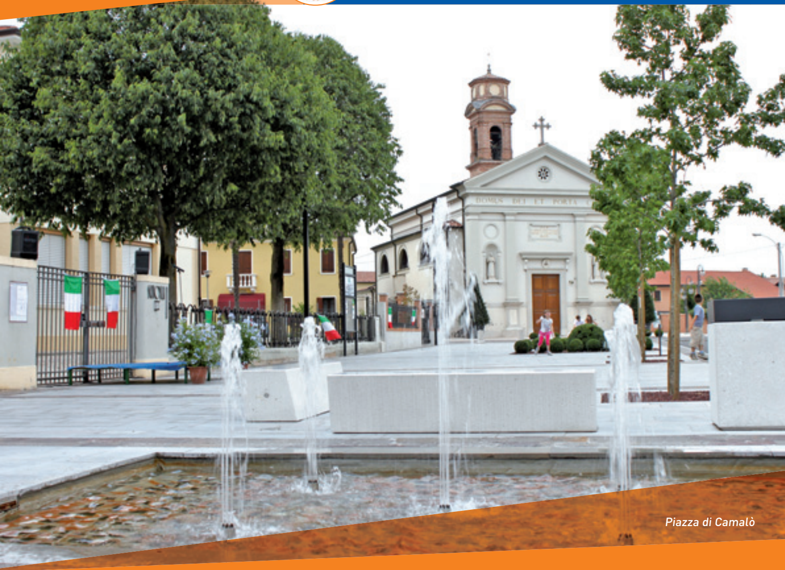
Piazza di Camalò

SEMESTRALE D'INFORMAZIONE DEL COMUNE DI POVEGLIANO