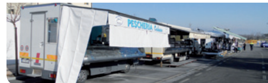
Il mercato a Povegliano

nomia; tra i generi non alimentari piante fiori e abbigliamento. Il progetto è partito in via sperimentale e l'intento è di rafforzarlo in base alle esigenze che emergeranno.