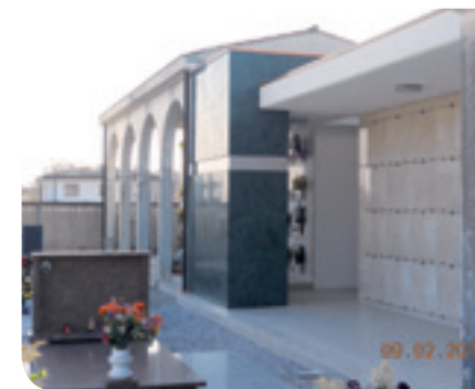
Nuovi loculi a Santandria

A dicembre sono stati sostituiti tutti i serramenti della palestra sostenendo una spesa di 23.000 euro.