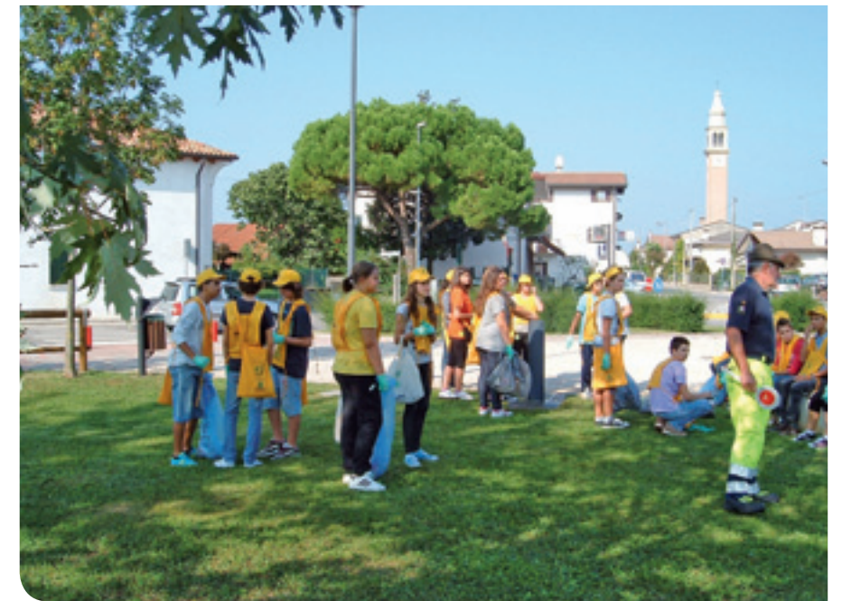
I ragazzi delle scuole medie in accolta rifiuti a Santandrà

I ragazzi, con passione ed eccitazione, hanno così iniziato a togliere cartacce, bottiglie ed altri materiali abbandonati partendo dal giardino della loro scuola per proseguire verso la piazza del municipio e da ultimo verso le vie di Santandrà e Camalò; in particolare si sono soffermati a raccogliere rifiuti nella pista ciclabile e nei parchi gioco. Nonostante la strada da percorre-