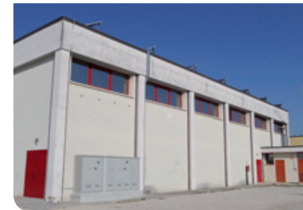
Nuovi serramenti per la palestra

A regime i risparmi in bolletta previsti per questo impianto sono di circa 10.000 all'anno.